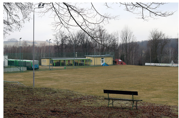
Umkleidekabinen im WKZ

Sperrgebiete: Es besteht Wegenutzungspflicht. Einige überwachte Wege sind auf der Karte mit orange gekennzeichnet (offenes Gebiet, befahren erlaubt). Diese dürfen ebenfalls genutzt werden. Das Fahren Abseits der Wege führt zur umgehenden Disqualifikation.