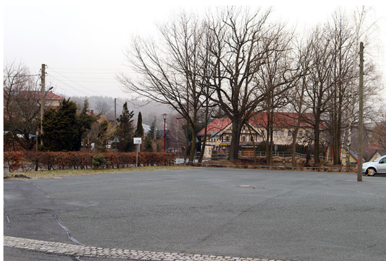
kostenfreie Parkfläche am WKZ